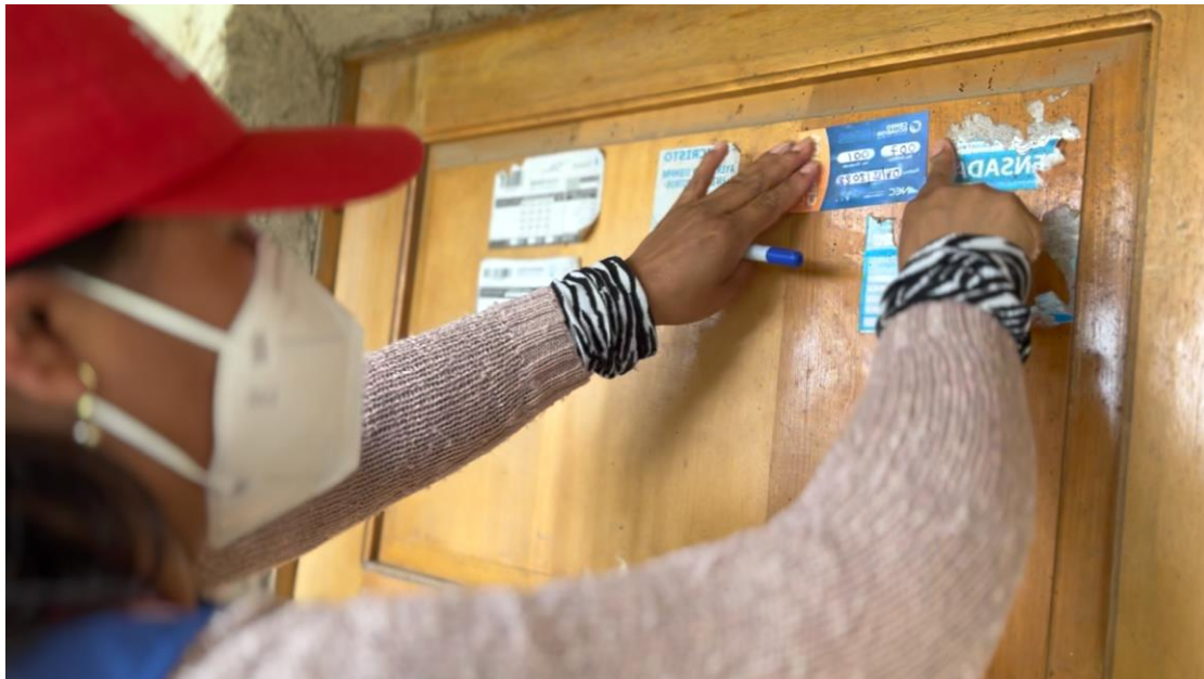
Ilustración 8. Censista del INEC colocando sticker de vivienda censada utilizando mascarilla como medida de bioseguridad durante la pandemia de COVID-19.

El Censo de 2022, representó un avance metodológico significativo al combinar la recolección de datos presencial con formularios digitales, permitiendo la participación a través del autocenso en línea o mediante entrevistas directas con censistas (dispositivos electrónicos (tablets) y cuestionarios físicos). Este enfoque mixto mejoró la eficiencia, redujo costos y facilitó el acceso a áreas de difícil cobertura.