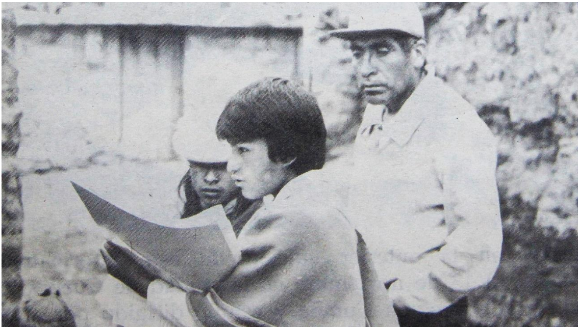
Ilustración 3. Joven empadronador indígena censando a una familia en Pilahuín, Ambato.

Para su organización, el presidente Guillermo Rodríguez Lara creó en 1973 la Oficina de Censos Nacionales, adscrita a la Junta Nacional de Planificación, encargada de ejecutar el censo (Junta Nacional de Planificación y Coordinación Económica, 1974). En 1976, se estableció el Sistema Estadístico Nacional y el Instituto Nacional de Estadística y Censos (INEC, 2018).