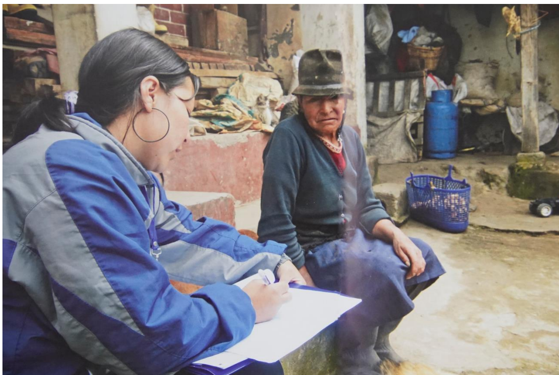
Ilustración 6. Censista levantando información en una vivienda de la Sierra.

El censo fue resultado de una planificación rigurosa que tomó 20 meses e incluyó una destacada colaboración de estudiantes, profesores y municipios (INEC, 2018). En esta edición se investigaron 49 preguntas, incorporando un módulo específico sobre emigrantes al exterior, dada la relevancia del fenómeno migratorio en ese periodo. Entre las nuevas variables también se incluyeron el material del almacén de la vivienda, la autoidentificación étnica, la tenencia de título universitario y la pertenencia a organizaciones campesinas. Además, se retomaron preguntas de censos previos, como la afiliación al seguro social y el idioma o lengua hablada, así como el registro sobre discapacidades, adaptado a un enfoque más actual.