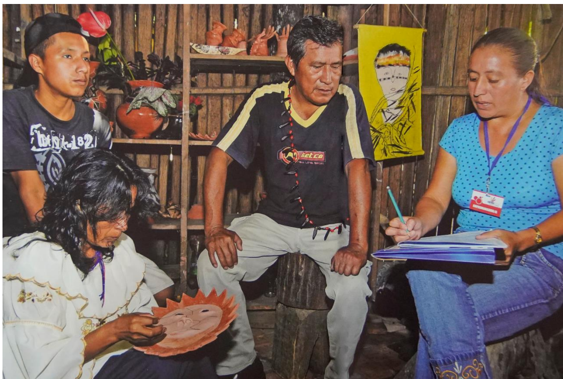
Ilustración 7. Personal del INEC censando en comunidades de la Amazonía.

Los censos de 2010 introdujeron importantes avances tecnológicos, como la cartografía digital, la automatización de las áreas de empadronamiento y el procesamiento de datos mediante escáneres ópticos de alta velocidad, que eliminaron los errores de digitalización manual. Estas innovaciones facilitaron un manejo más eficiente de la información y potenciaron su uso en ámbitos académicos, empresariales y de investigación.