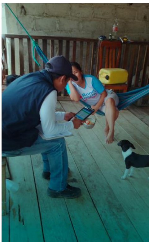
Ilustración 9. Censista del INEC realizando entrevista con Tablet.

El Censo de 2022, representó un avance metodológico significativo al combinar la recolección de datos presencial con formularios digitales, permitiendo la participación a través del autocenso en línea o mediante entrevistas directas con censistas (dispositivos electrónicos (tablets) y cuestionarios físicos). Este enfoque mixto mejoró la eficiencia, redujo costos y facilitó el acceso a áreas de difícil cobertura.