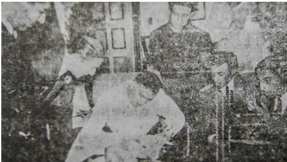
Ilustración 2. Galo Plaza Lasso, presidente de la República durante el empadronamiento de 1950.

El Ecuador inició su estadística censal moderna el 29 de noviembre de 1950, con la realización del primer censo nacional de población bajo el gobierno de Galo Plaza Lasso. En esa época, el país enfrentó diversos desafíos, como la falta de experiencia en censos de esta magnitud, una alta ruralidad, una sociedad socialmente heterogénea, limitaciones en las vías de comunicación y prejuicios adversos hacia el levantamiento de información.