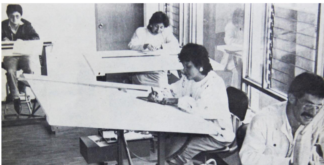
Ilustración 4. Dibujantes de cartografía en las instalaciones del INEC.

Este censo se realizó durante el gobierno de Osvaldo Hurtado Larrea y movilizó aproximadamente a 100,000 empadronadores en un solo día para censar a la población urbana, mientras que, para la población rural, dispersa en ocho días, participaron 10,000 censistas (INEC, 2018).