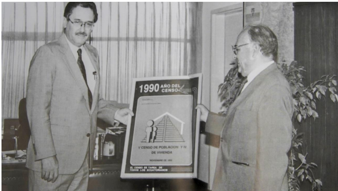
Ilustración 5. Presentación de resultados del censo de 1990 a Luis Parodi Valverde, ex vicepresidente de Ecuador.

El contenido temático fue definido en colaboración con los principales usuarios de los datos y especialistas en temas demográficos y sociales, atendiendo las necesidades del país y asegurando la continuidad histórica para la comparabilidad temporal y geográfica. Se evitaron preguntas que pudieran generar temores o prejuicios entre los informantes, priorizando claridad y sencillez en su formulación.